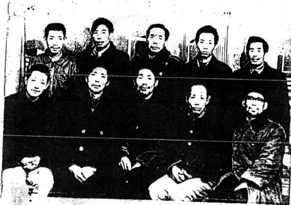
守生 守发 重阳 华明 东俊 右后 守中 和平 政标 政义 政柏 右前