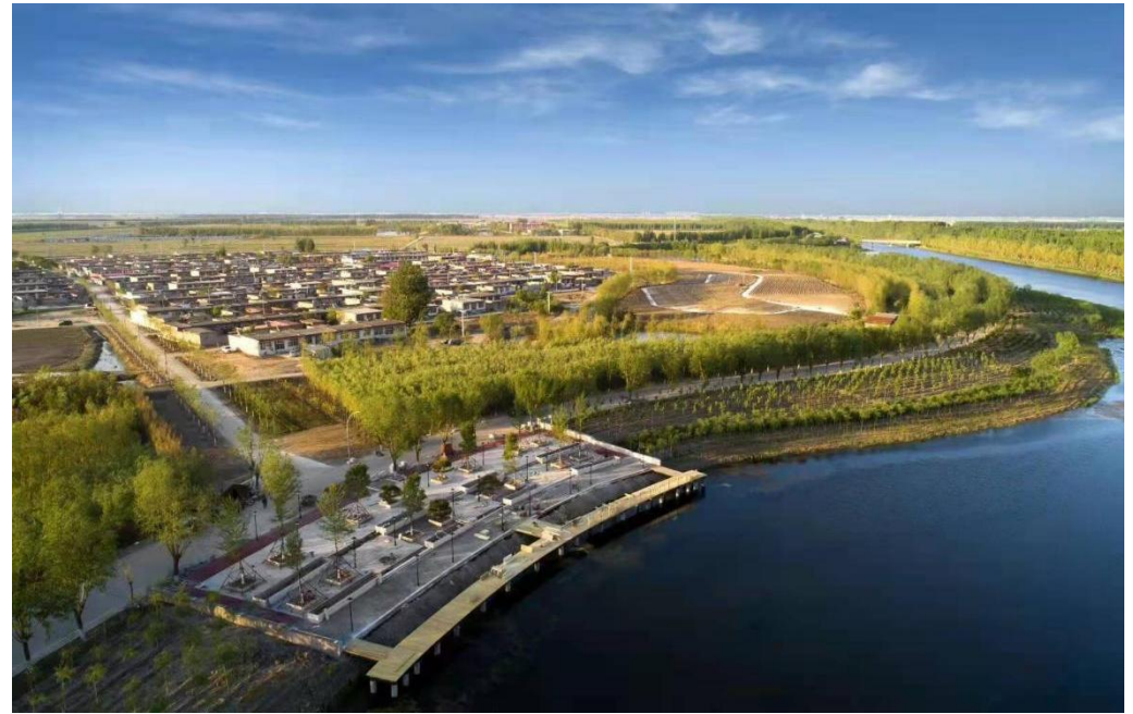
王打刁村局部俯瞰景及眾濟湖