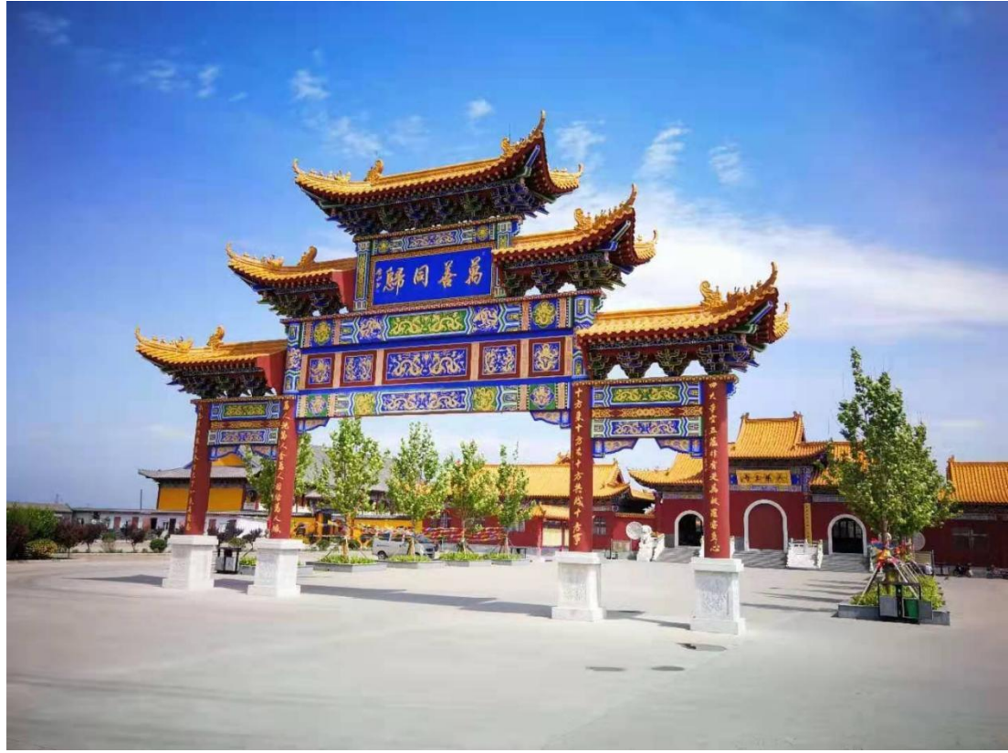
寺王藥大村刁打王