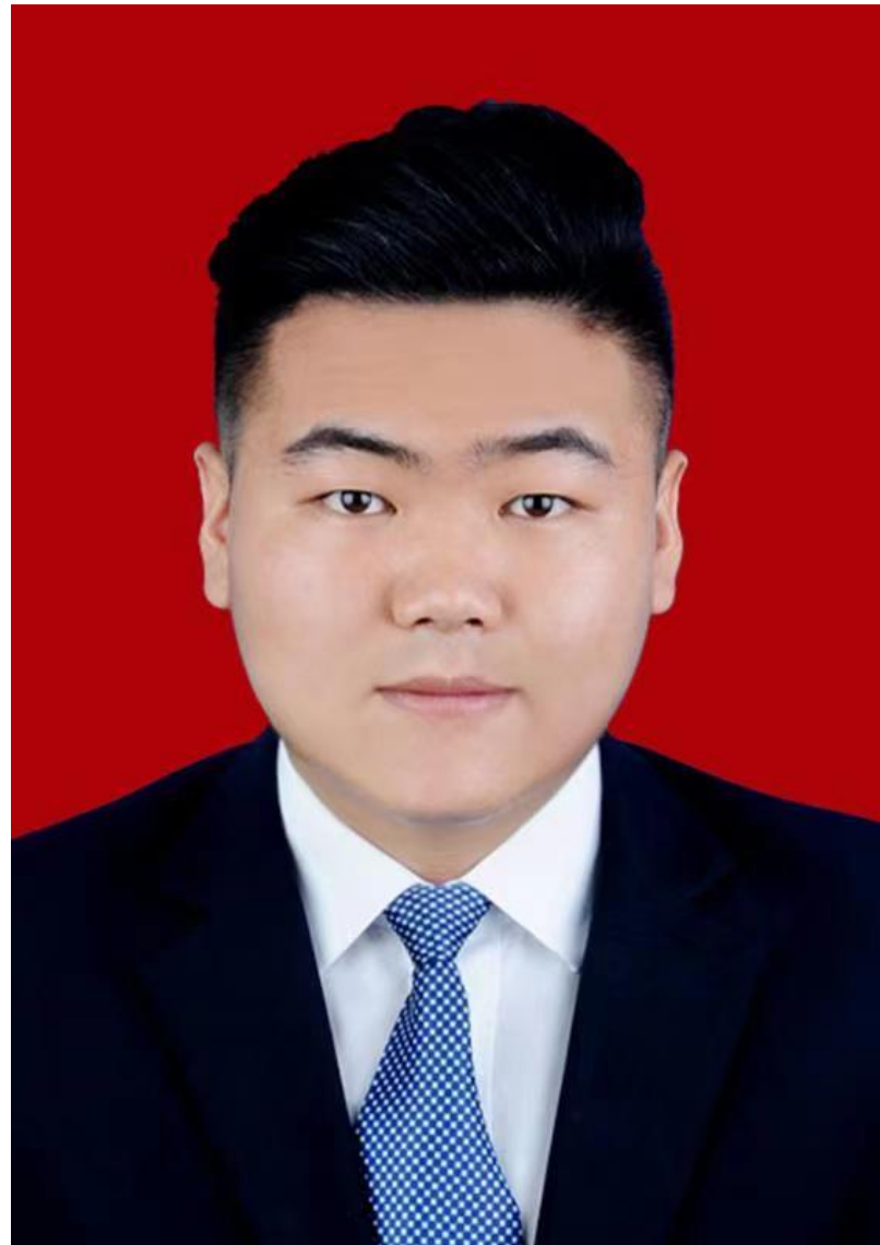
主修 一十八世孫長宇