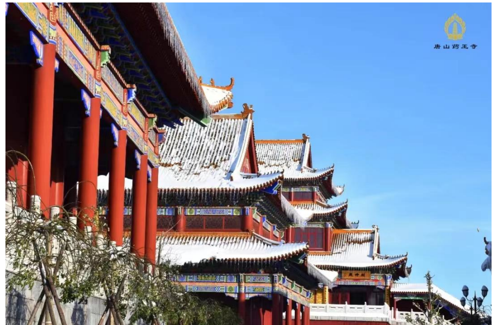
王打刁村大藥王寺