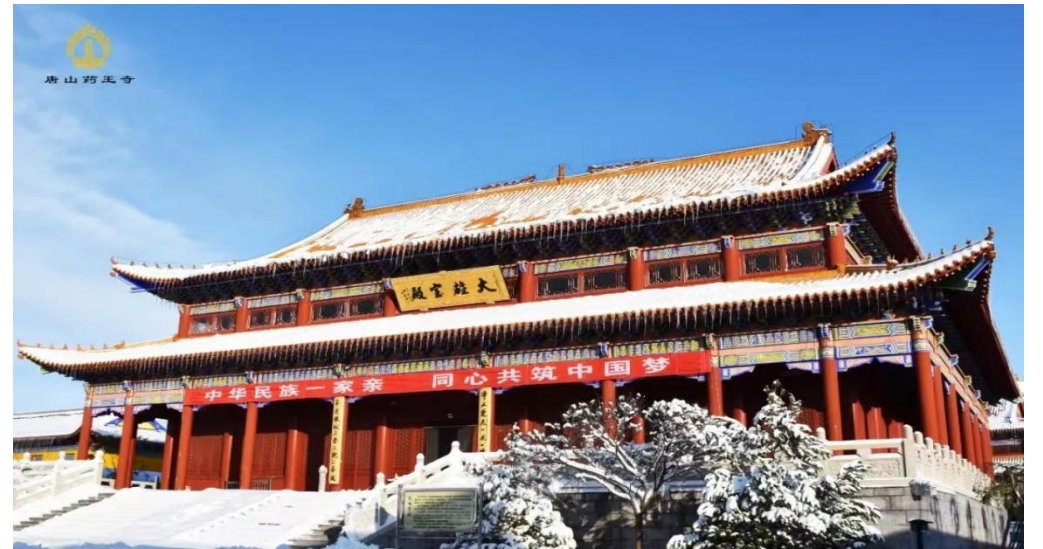
大藥王寺大雄寶殿