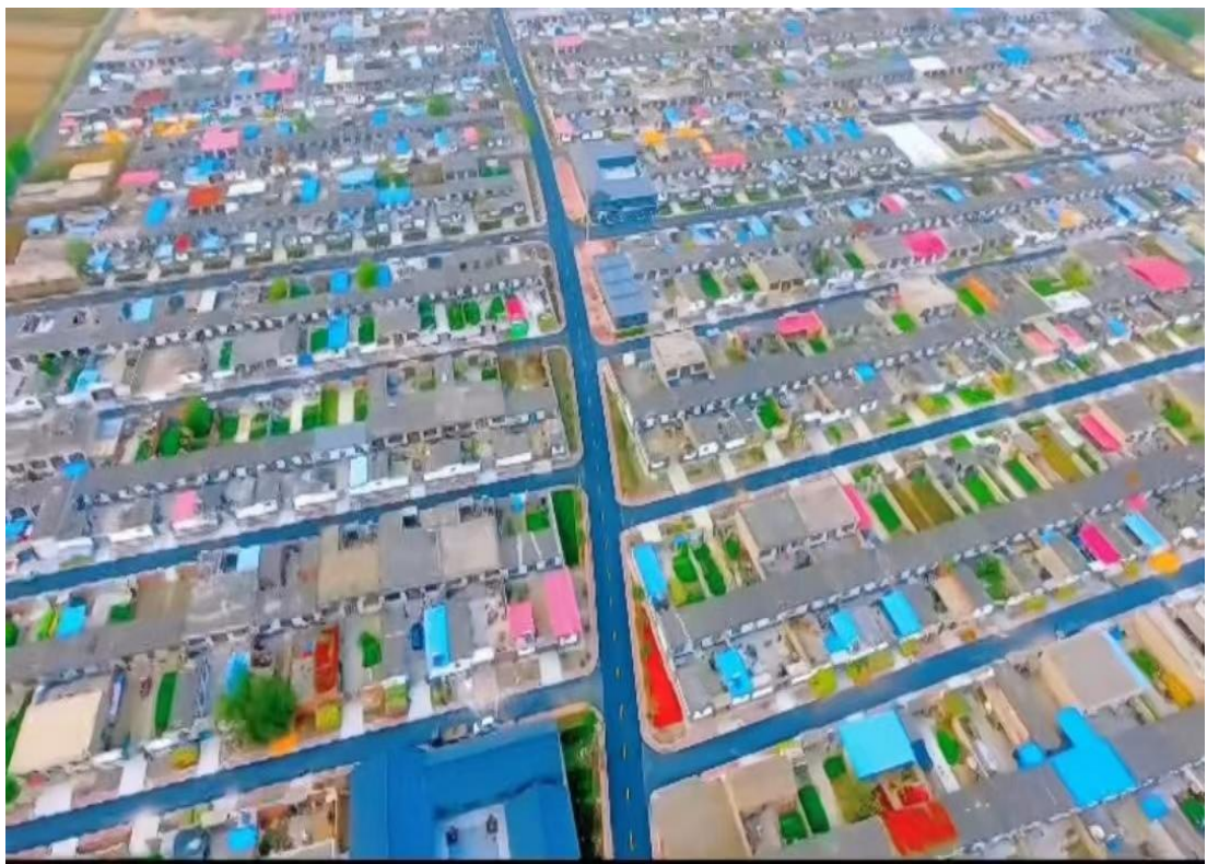
王打刁村村內街道