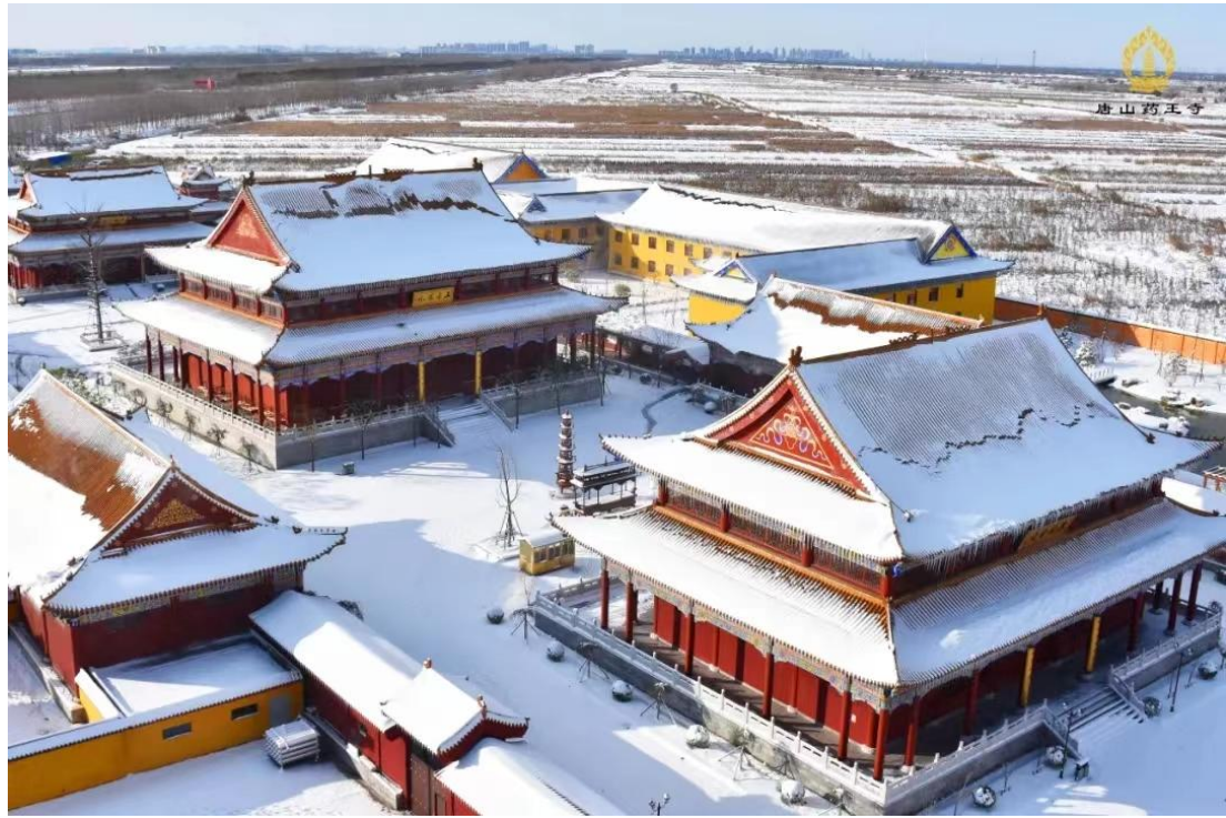
寺王藥大村刁打王