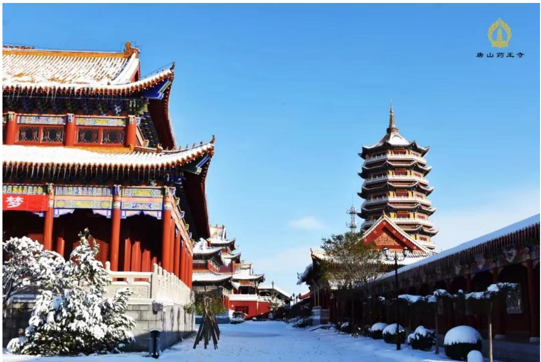
寺王藥大村刁打王