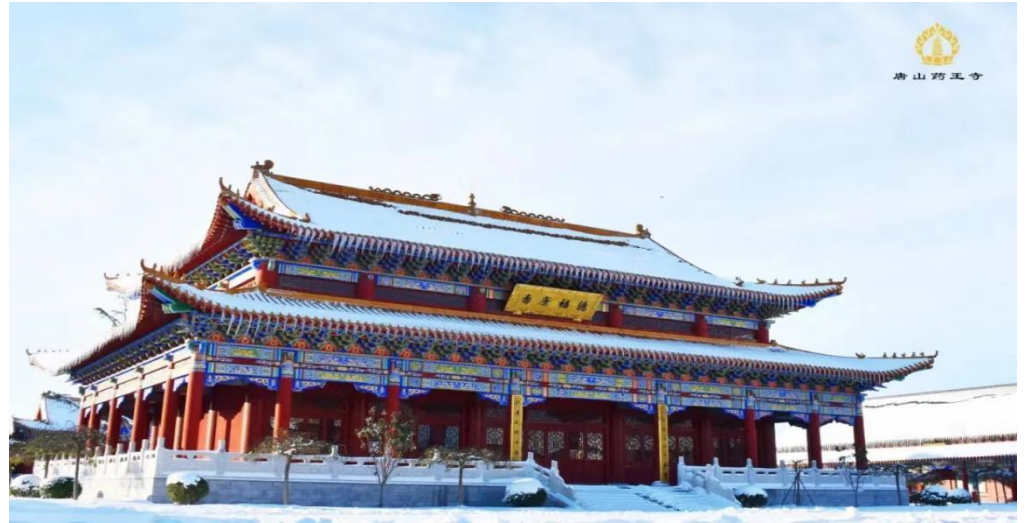
大藥王寺大雄寶殿