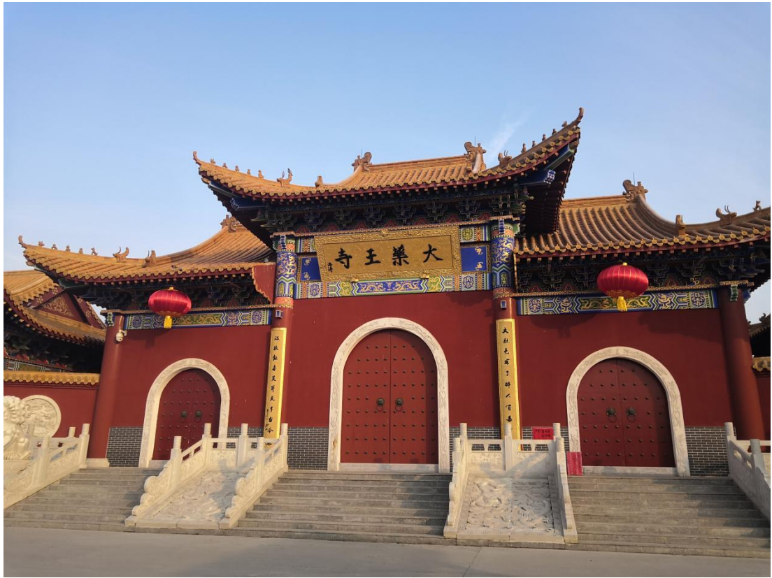
門山寺王藥大村刁打王