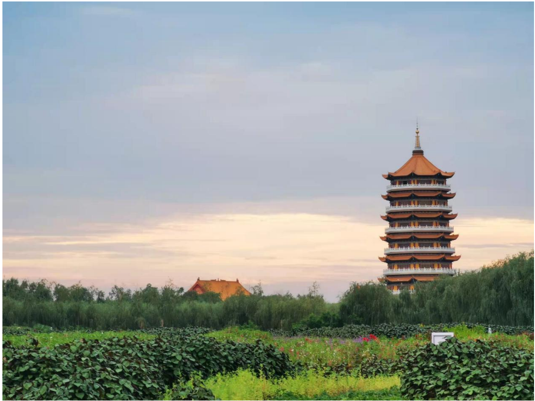
塔寶璃琉佛萬寺王藥大村刁打王