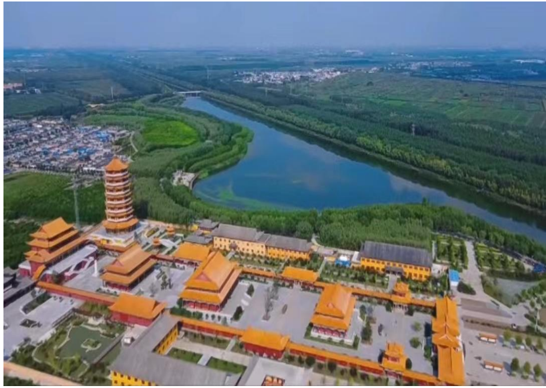
湖濟眾及寺王藥大村刁打王