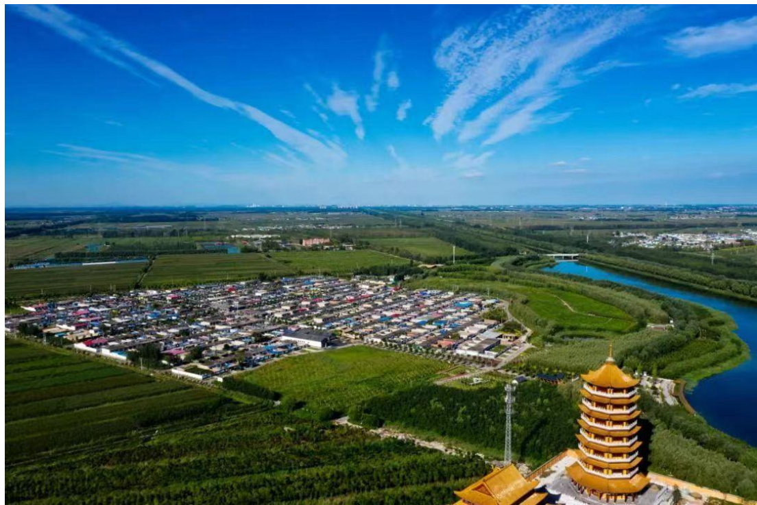
王打刁村俯瞰全景