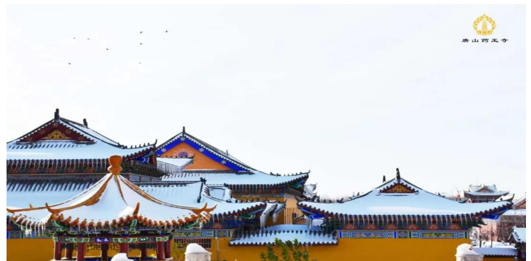
王打刁村大藥王寺